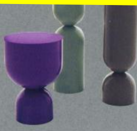
6. POLTRONA FRAU